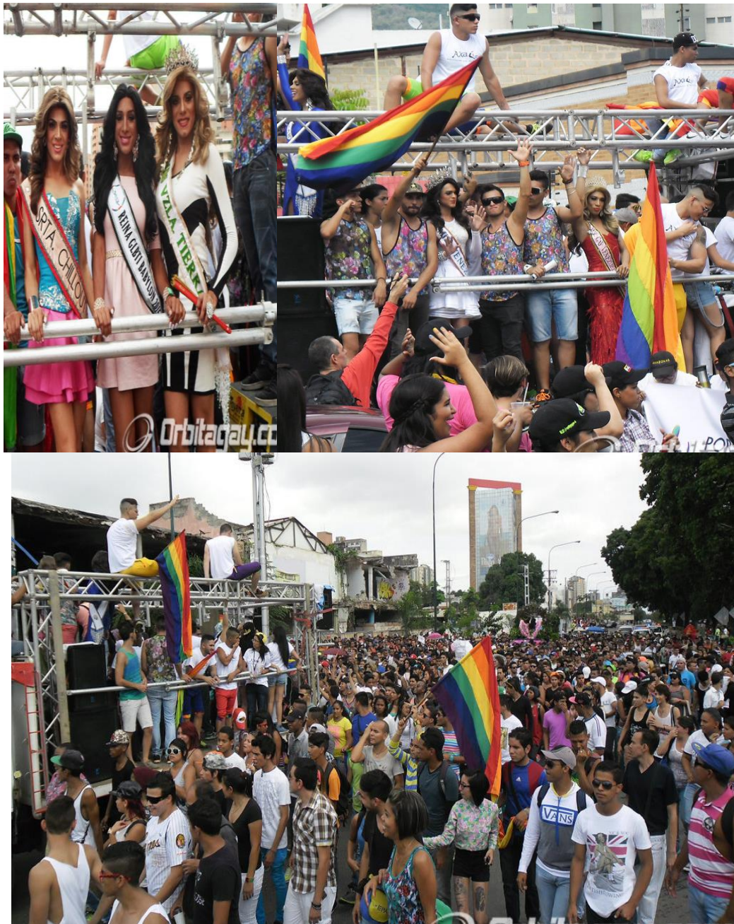
Marcha LGBTI de Valencia en 2015.