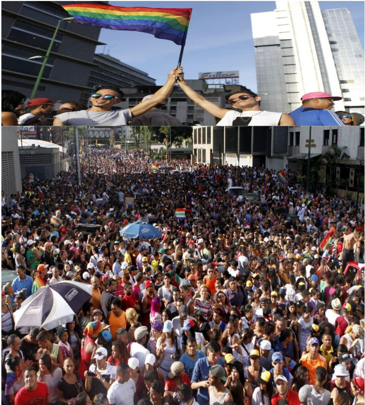
Marcha LGBTI de Caracas en 2016.