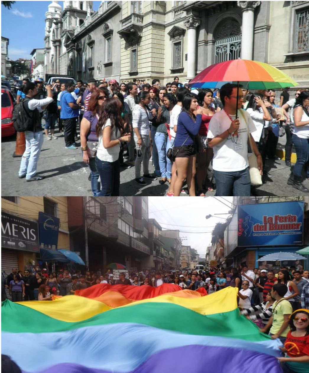
Arriba, Primera Marcha del Orgullo Gay de Mérida, celebrada en 2013. Abajo, Segunda Marcha Gay de Mérida, año 2014.