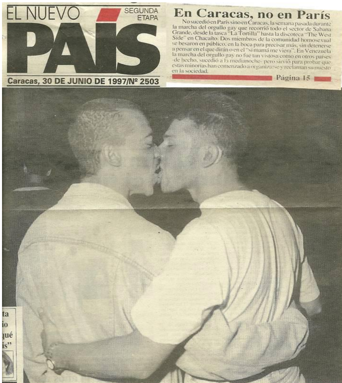
Imágenes afectivas de la Primera Marcha Gay realizada en Caracas en 1997.