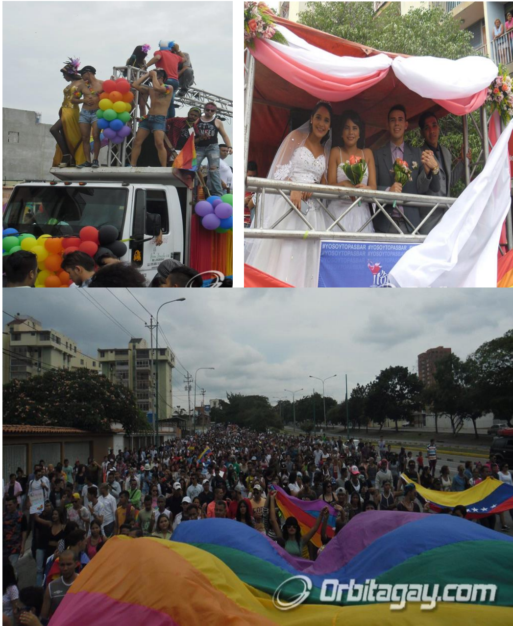
Segunda Marcha LGBTI de Barquisimeto.