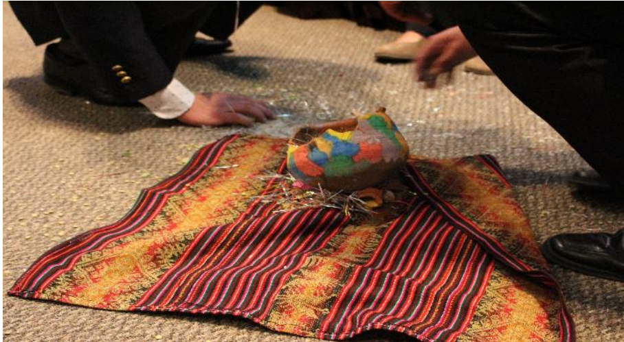
Acto de Inauguración de la Cumbre LGBTI 2017

A través del debate entre los representantes de las organizaciones, se extrajeron recomendaciones para cada uno de los Estados, con la intención de que las mismas se hagan extensivas a las instituciones públicas de cada país y se aporte al avance y conquista de los Derechos Humanos de personas con diversa orientación sexual e identidad de género.