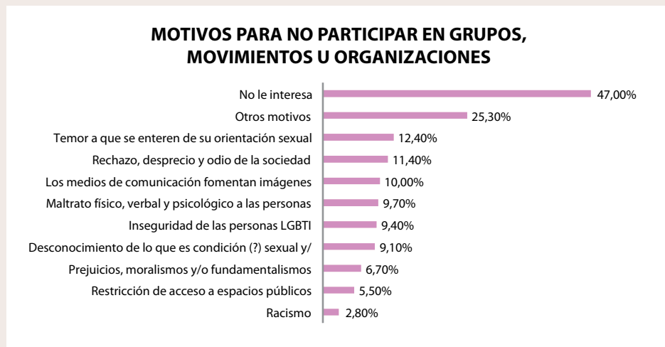
Gráfico 02.

La información que se pudo obtener, a base de consulta directa a un candidato LGBTI a Asambleísta Nacional, fue que en el próximo proceso electoral que se llevará a cabo en febrero de 2017, para elegir Presidente y Vicepresidente de la República, así como a Asambleístas Nacionales y Provinciales (Distritales), participaron diez (10) personas LGBTI de las provincias de Guayas (6) Pichincha (2) Azuay (1) y Loja (1).